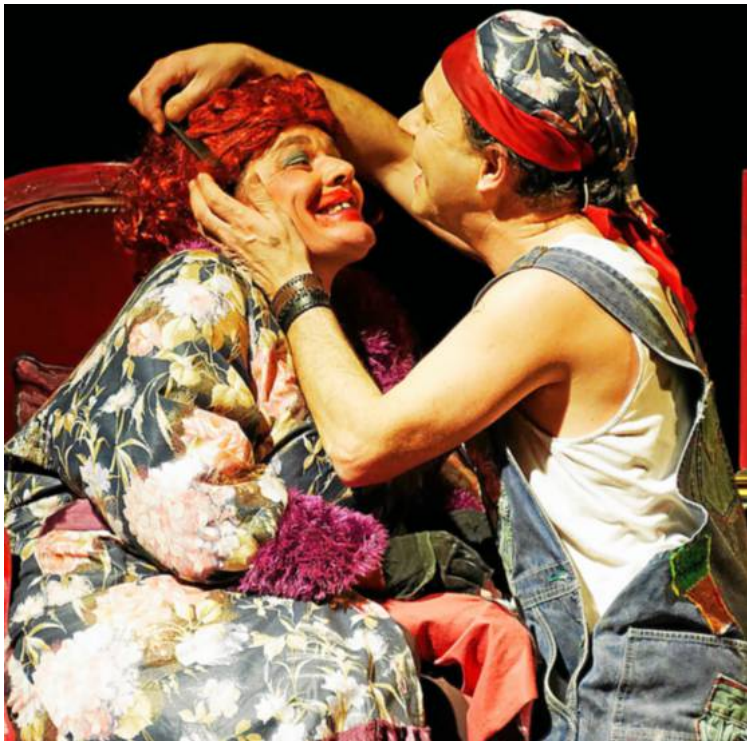
« Madame Rosa reine de la pop » est joué ce soir, à 20 h 30.

Pour cette avant-dernière soirée du festival du Pont-du-Bonhomme, trois spectacles et quatre représentations sont proposés sur le site du cimetière de bateaux de Kerhervey, par la compagnie de l'Embarcadère, organisatrice du festival depuis 20 ans.