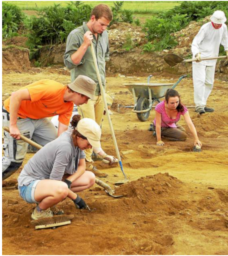
L'équipe de fouilleurs a découvert, cette année, que les Romains auraient occupé le site.