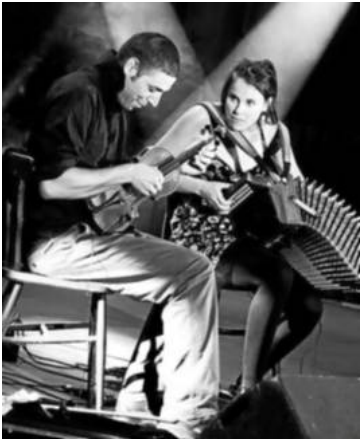
Dans le cadre des Mercredis sans chichi, l'association Son Ar Leurrenn propose un concert accordéon et violon.

Aujourd'hui, au programme du rendez-vous hebdomadaire de Riante, Les Mercredis sans chichi, mis en place par les affaires culturelles, deux animations : à 18 h, un spectacle de clown gratuit à vivre en