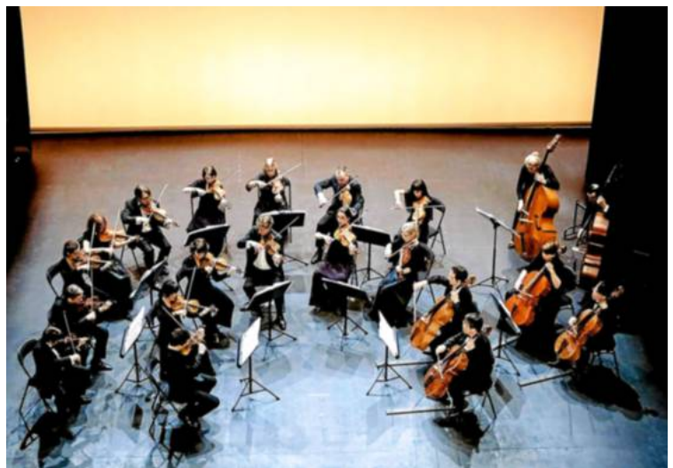
L'orchestre d'Auvergne sera dirigé par Roberto Forés Veses.

Pour l'avant-dernier concert de la saison, les organisateurs du festival Polignac proposent un récital d'Abdel Rahman el Bacha, accompagné de l'orchestre d'Auvergne.