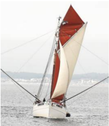
Le thonier Biche accompagne la Route de l'amitié et fera escale à Groix.

La flottille de 160 bateaux arrive cet après-midi, à Port-Tudy, à Groix (les places de port sont toutes réservées pour cette escale).